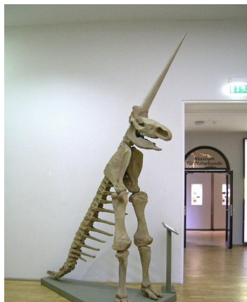
3. ábra: A „magdeburgi unikornis” a Magdeburgi Természettudományi Múzeumban. Virálissá vált kép, az alkotója ismeretlen

Szilágyi N. elképzelt nyelvtörténésze úgy gondolná, hogy „egyik hiedelemlény nevét a másikra vitték át”. Ilyen kétségtelenül előfordulhat, de a képzeletbeli nyelvésznek azért csak szöveget üthetne a fejébe, hogy a mókus, bármennyire is szent, mégiscsak egy apró szőrös rágcsáló, míg a sárkány hüllőszerű, és tipikusan hatalmas lény. Más forrásokból (pl. Márton 1972: 279; Márton et al. 1977: 133; Mokány 1997: 77) kiderül ugyan, hogy az ezmó ’vitéz, táltos ló’ jelentésben is előfordul, de az utóbbi magyarázható legalább azzal, hogy két nagy állatról van szó, ráadásul a sárkány gyakran tüzet okádik, míg a táltos ló parazsat eszik, valami hasonlóság mégis van közöttük. Bár a magyar nyelvű szakirodalom erre a jelentésére valamiért nem utal, román forrásokból (Macrea 1958: 958; Breban 1980: 679; Vinereanu 2008: 922) világos, hogy a román szó elsődleges jelentése is ’mesebeli gonosz óriás’, de ezen és a ’sárkány’ jelentésen kívül ’hős, vitéz’, ’táltos ló’ és ’papírsárkány’ jelentésben is használatos. Az kevésbé furcsa, hogy a szó az utolsó jelentésében nem került át, vagy legalábbis nincs dokumentálva a magyarban, az viszont furcsa, hogy az elsődleges román jelentés a magyar nyelv román jövevényszavainak szótáraiban nem fordul elő (de vö. ÚMTSz. 2: 241; Márton 1977: 72).